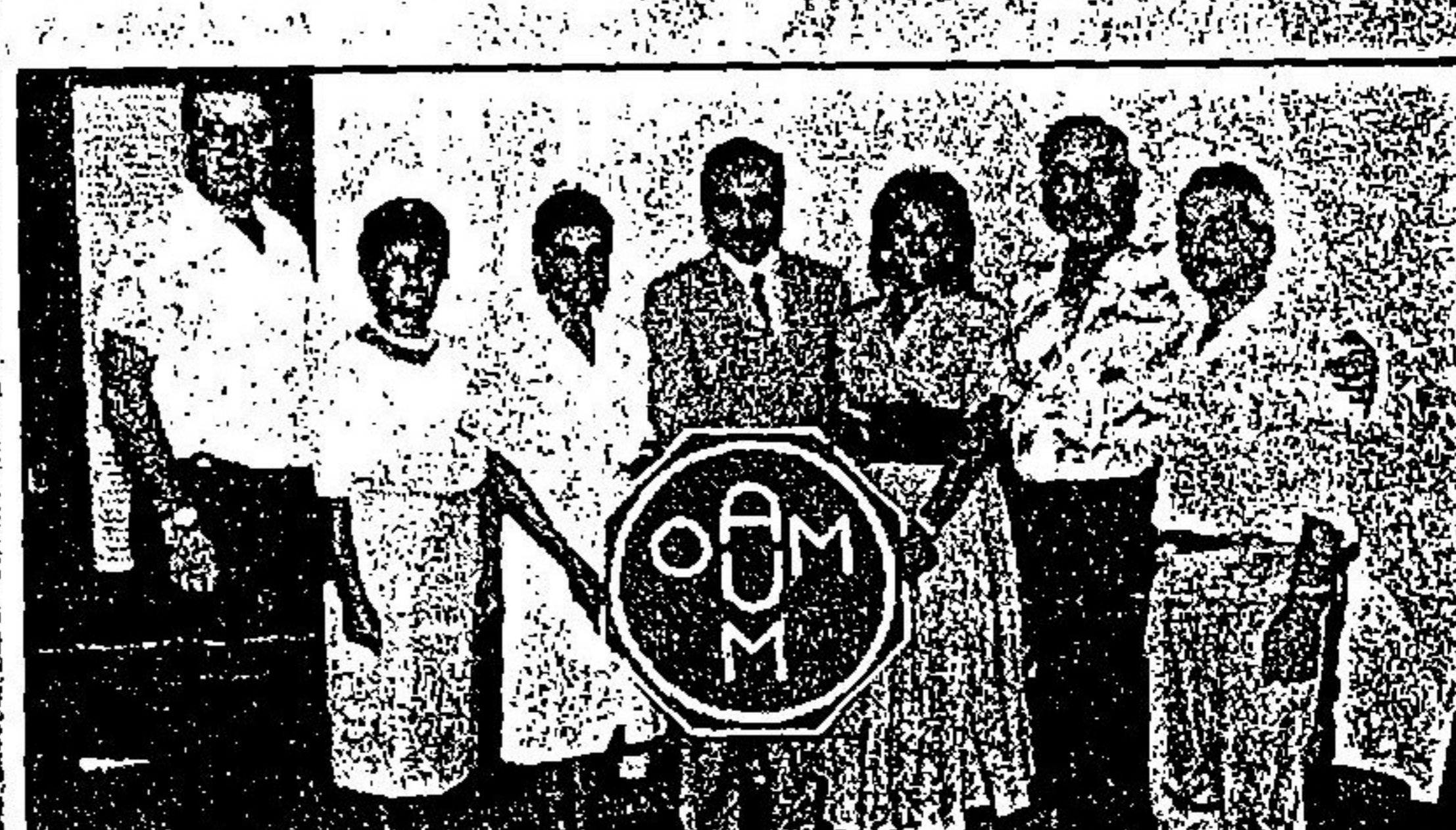
اللجنة التأسيسية حول رئيس الجمعية والشعار.