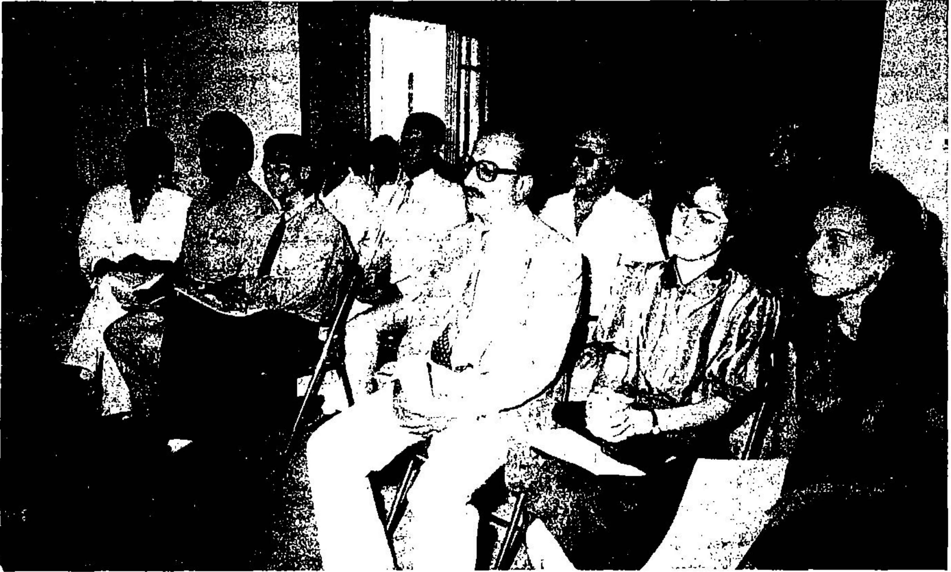
لقطة من اللقاء الصحافي